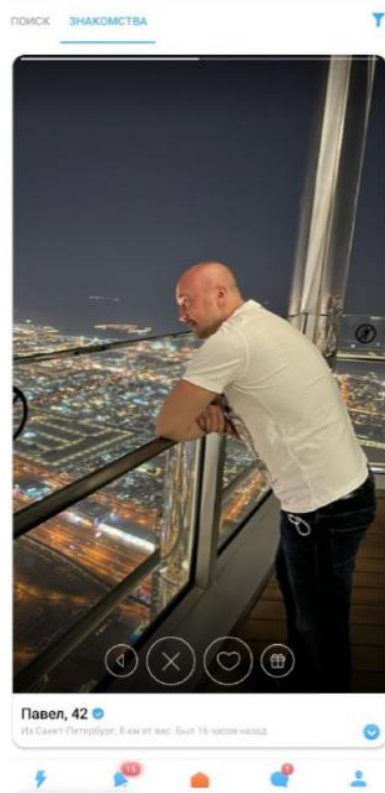
Рисунок 3 – Анкета пользователя

3.2.8. Если авторизация прошла успешно, на экране отобразится одна из анкет, выбранная сервисом при помощи первичного параметрического поиска из базы зарегистрированных анкет (рис. Ошибка! Источник ссылки не найден. ).