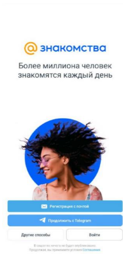
Рисунок 3 – Экран регистрации и авторизации

3.2.2. Запустите мобильное приложение (п. 3.1.1). Перед вами появится экран регистрации и авторизации (рис. 3).